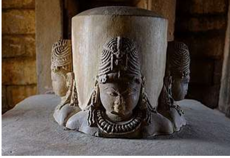
चित्र क्र. १२ ब्रह्मा मंदिर, खजुराहो

ब्रह्मा मंदिर म्हणून अनेक मंदिरे सांगितली जातात जसे की खजुराहो येथील ब्रह्मा मंदिर. परंतु इथे एक मुख्य गोष्ट लक्षात घ्यायला हवी ती म्हणजे ही ब्रह्मलिंगेश्वर मंदिरे असतात. मुख्यत्वे ते देऊळ हे शिवाचे असते आणि त्या शिवलिंगात चार बाजूंना चार मुखे कोरलेली असतात आणि म्हणून मग ते ब्रह्मदेवाचे देऊळ आहे असे समजले जाते. खजुराहो येथील हे मंदिर ब्रह्मा मंदिर म्हणूनच प्रसिद्ध आहे परंतु ह्या मंदिराच्या ललाटपट्टीवर विष्णू कोरलेला असल्याने ते विष्णूचे मंदिर असावे. तेथे गर्भगृहातील मुख्य देवता म्हणून शिवलिंग स्थापन केलेले आहे. हे शिवलिंग चार मुखांनी युक्त असल्याने चुकीने हे ब्रह्मा मंदिर असल्याचे रूढ झाले आहे.