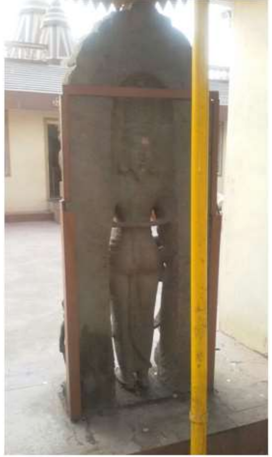
चित्र क्र. १५ व १६ ब्रह्मदेव, रामेश्वर मंदिर, ठाणे.

सिद्धेश्वर तलावात ही मूर्ती १९९५ मध्ये सापडली असून तलावाच्या बाजूलाच असलेल्या रामेश्वर मंदिराच्या बाहेरील भागात ठेवलेली आहे. ही मूर्ती देखील १० वे शतक ते १२ वे शतक ह्या काळातील असून शैली मात्र गुर्जर आणि कर्नाटक अशी मिश्र आहे. ही मूर्ती चारही बाजूंनी कोरलेली आहे. मूर्तीला प्रभावळ असल्याने ही मंदिरातील मुख्य मूर्ती असावी असे वाटते. प्रभावळीसकट मूर्तीची उंची १.९३ मीटर आहे. चतुर्मुखी ब्रह्मा असून चारही मुखांना दाढी दाखविलेली आहे. मागचे चौथे मुखही कोरलेले आहे. परंतु दुर्दैवाने मूर्तीचे चारही हात कोपरापासून भंग आहेत. देवाच्या दोन्ही बाजूंना शक्ती आहेत. उजव्या बाजूच्या शक्तीने आज्यस्थळी धारण केली असून डाव्या बाजूच्या शक्तीचा हात भंग असल्याने तिने काय धारण केलेलं आहे ते समजत नाही परंतु बहुधा तिने पुस्तकच धरलेलं असावे. मूर्तीवर हरणाचे कातडे नाही. देवाच्या दोन्ही बाजूला शक्तींच्या जवळ दोन हंसही दाखविलेले आहेत. नालासोपारा येथील मूर्तीपेक्षा या मूर्तीमध्ये दाखवलेल्या शक्तींचा आकार मोठा आहे. (Kanitkar, 2011 : 10)