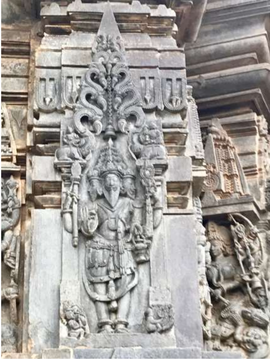
चित्र क्र. १८ ब्रह्मा मूर्ती, बेलुर