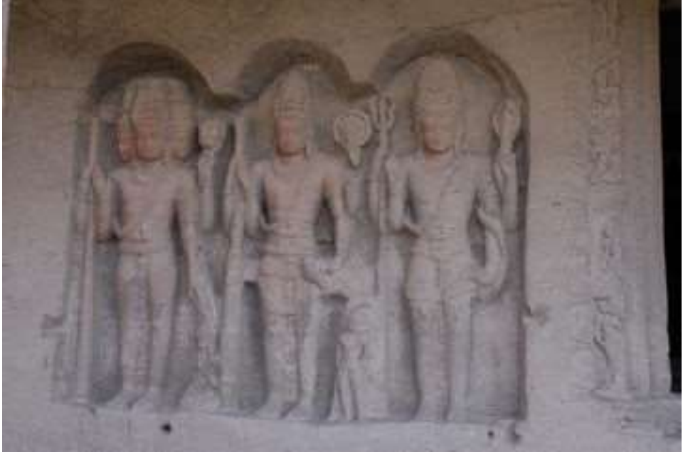
चित्र क्र. ३४ त्रिमूर्ती, वेरुळ

या गुंफेमधूनच पुढे तीन छोटी गर्भगृहे आहेत; ह्या तीन गर्भगृहांत डावीकडून शिव, विष्णू आणि ब्रह्मा आहेत. ह्या तीनही मूर्ती स्थानक आहेत. चतुर्मुखी व चतुर्भुज ब्रह्मदेवाची मूर्ती येथे आहे. खालील उजव्या हातात अक्षमाला असून तो हात वरद मुद्रेत आहे. बाकीच्या हातात काय आहे ते स्पष्टपणे दिसत नाही. कमरेवर मेखला धारण केली असून यज्ञोपवीत आहे.