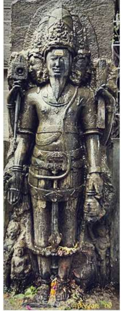
चित्र क्र. १३ ब्रह्मदेव, नालासोपारा, पालघर..