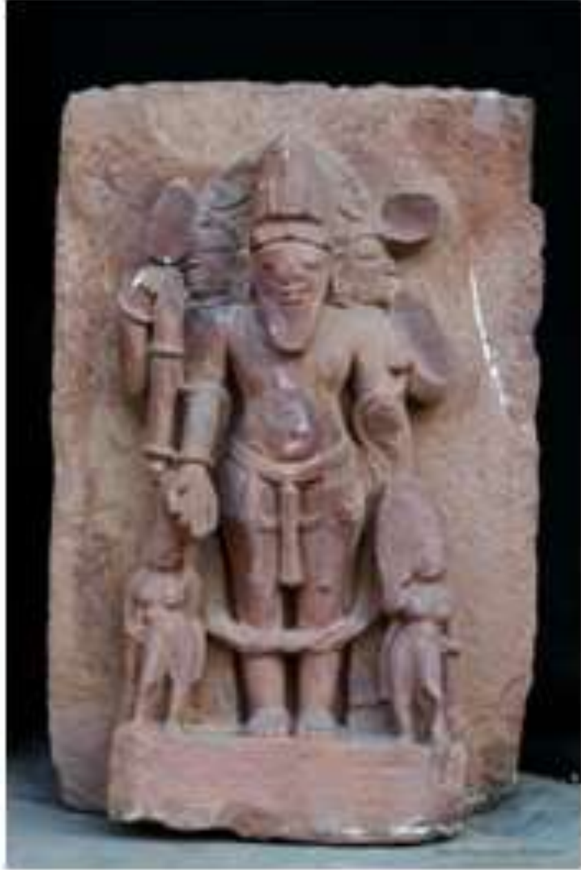
चित्र क्र. २४ ब्रह्मदेव, जामसोट, अलाहाबाद

अलाहाबाद वस्तुसंग्रहालयात ही मूर्ती असून ही उत्तर प्रदेशातील जामसोट या गावात सापडली आहे. ही मूर्ती १२ व्या शतकातील असून साधारण १ मीटर उंचीची आहे. एखाद्या मंदिराच्या भिंतीचा हा तुकडा असावा असे वाटते. मूर्ती खूपच भंगलेल्या अवस्थेत असल्याने चारही हातातील आयुधे समजत नाहीत. ही मूर्ती त्रिमुखी असून दर्शनी मुखालाच दाढी आहे. खाली दोन्ही बाजूस ब्रह्माच्या शक्ती सावित्री व गायत्री आहेत. (Mishra, 1989 : 44)