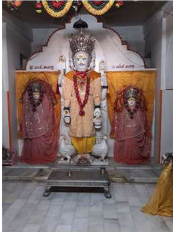
चित्र क्र. ५ ब्रह्मादेव प्रतिमा, खेडब्रह्म

पुष्कर येथील मंदिराच्या खालोखाल कोणत्या मंदिराला महत्त्व असेल तर ते हे खेडब्रह्म येथील मंदिर. गुजरातमधील सध्याच्या साबरकंठा जिल्ह्यात हे मंदिर असून हरणाई, कोसंबी आणि भीमाशंकरी ह्या नद्यांच्या संगमावर आहे. (Gazetteer of the Bombay Presidency, 1901 : 549) येथे ब्रह्मा, अंबिका आणि पंखनाथ महादेव अशी तीन महत्त्वाची मंदिरे आहेत. मंदिरांबरोबरच इथे पायऱ्या असलेल्या दोन विहिरी आहेत. ब्रह्मा बाव व अदिती बाव अशी त्यांची नावे आहेत. आदिती बाव येथील १३व्या शतकातील शिलालेखावरून हा प्रदेश पूर्वी खूपच समृद्ध होता. तसेच इथे अनेक मंदिरे व विहिरी होत्या असे दिसते. ह्या प्रदेशावर आधी भिल्ल राजा तारासंग ह्याची सत्ता होती; त्याचा पराभव परमार राजांनी केला आणि त्यानंतर ह्या भागावर