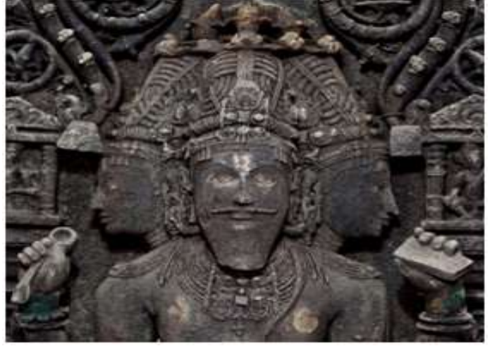
चित्र क्र. ८ व ९ ब्रह्मदेव मूर्ती, ब्रह्माकरमाळी.