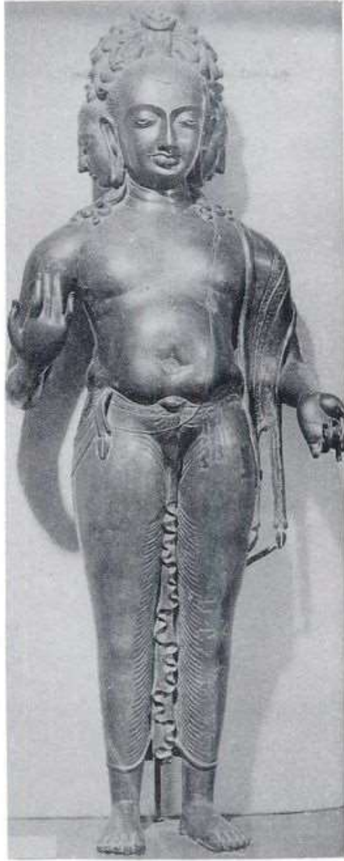
चित्र क्र. ४१ ब्रह्मदेव ब्राँझ मूर्ती, मिरपूर, पाकिस्तान.

मिरपूर खास हे शहर पाकिस्तानातील सिंध प्रांतात आहे. तेथील ही मूर्ती असून ही ब्राँझ धातूची आहे. ही ५व्या किंवा ६व्या शतकातील असून धातूच्या मूर्तीमधील सर्वात जुनी मूर्ती आहे. पाकिस्तानातील सिंध प्रांतात एका शेतात ही मूर्ती सापडली. चतुर्मुखी ब्रह्मदेवाची ही मूर्ती ०.९१४ मीटर उंचीची असून तिला दोनच हात आहेत. धोतर आणि यज्ञोपवीत धारण केलेलं असून अलंकार मात्र अजिबात नाहीत. गुप्तकाळातील मूर्तिकलेचा हा उत्तम आविष्कार आहे. (Sind Quarterly Vol. 8, Shah Abdul Latif Cultural Society, 1980)