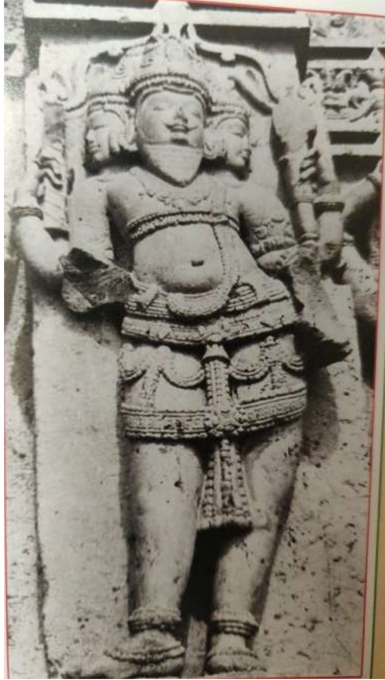
चित्र क्र. २३ ब्रह्मा मूर्ती, धर्मापुरी

खालील दोन्ही हात भग्नावस्थेत आहेत, उजव्या वरच्या हातात सुक तर डाव्या हातात कुश धरलेले आहे. दोन्ही प्रतिमेतील ब्रह्मा त्रिमुख व दाढी मिशा असलेला आहे. (देशमुख, २०१७ : ११७-११८)