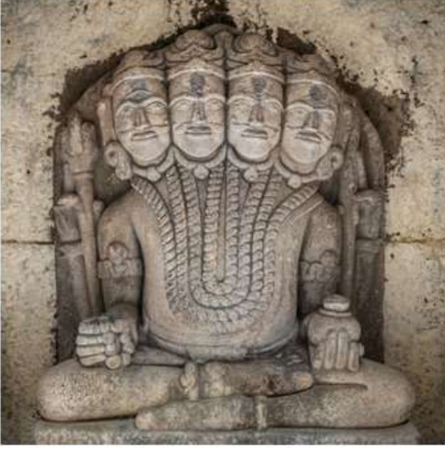
चित्र क्र. २७ ब्रह्मा मूर्ती, पाटेश्वर, सातारा

वर पाहिलेल्या संगम माहली येथील मूर्तीशी साधर्म्य असलेली आणखी एक मूर्ती पाटेश्वर येथे आहे. ह्या मंदिरासमूहामध्ये अष्टादशभुजा महिषासुरमर्दिनी मंदिरासमोर दोन लहान मंदिरे