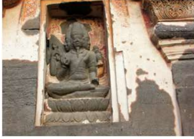
चित्र क्र. २० ब्रह्मा मूर्ती, वेरूळ गुंफा १६

औरंगाबाद शहरापासून ३० कि.मी.अंतरावर वेरूळची जगप्रसिद्ध लेणी आहेत. सह्याद्रीच्या सातमाळा डोंगररांगांच्या कड्यात इसवी सनाच्या ५ व्या ते १० व्या शतकात कोरून काढलेली ही लेणी आहेत. ह्यामध्ये गुंफा १६ म्हणजेच कैलास मंदिर आहे. हे द्राविड शैलीचे मंदिर असून शिवाचे आहे. ह्या ठिकाणी बाहेरील भिंतीवर ब्रह्मदेवाच्या प्रतिमा आढळतात. काही स्थानक प्रतिमा आहेत. त्याच बरोबर कल्याणसुंदर मूर्ती देखील आहेत. रमणशिल्पपटाच्या बाजूलाच एक