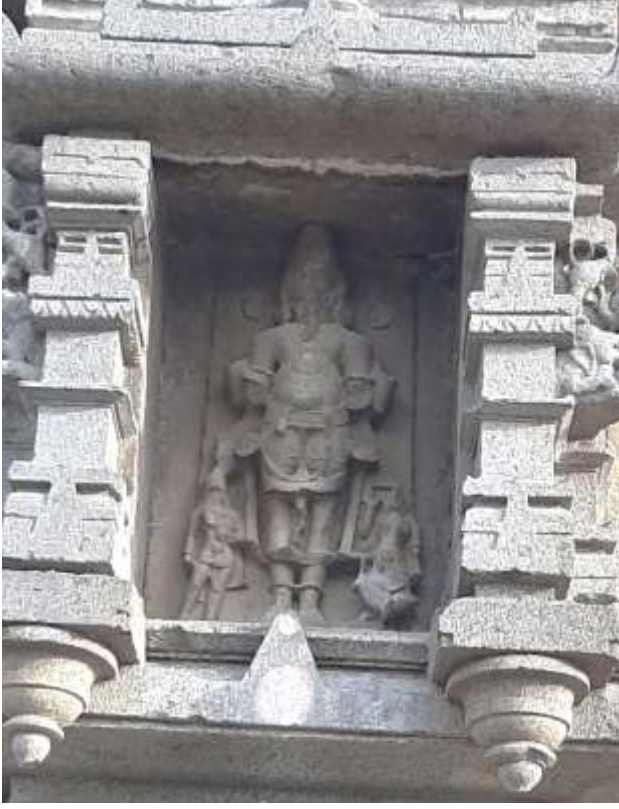
चित्र क्र. २२ एकमुखी ब्रह्मदेव, बीड,

देवाच्या उजव्या बाजूला सरस्वती तर डावीकडे सावित्री आहे. सरस्वतीच्या बाजूलाच हंस असून देवाच्या मधल्या मुखालाच दाढी आणि मिशा आहेत. ब्रह्मा सालंकृत असून डोक्यावर कीर्तिमुख आहे. बीड येथीलच कंकालेश्वर मंदिरावर पूर्व, पश्चिम व उत्तराभिमुख अशा ब्रह्मदेवाच्या तीन मूर्ती