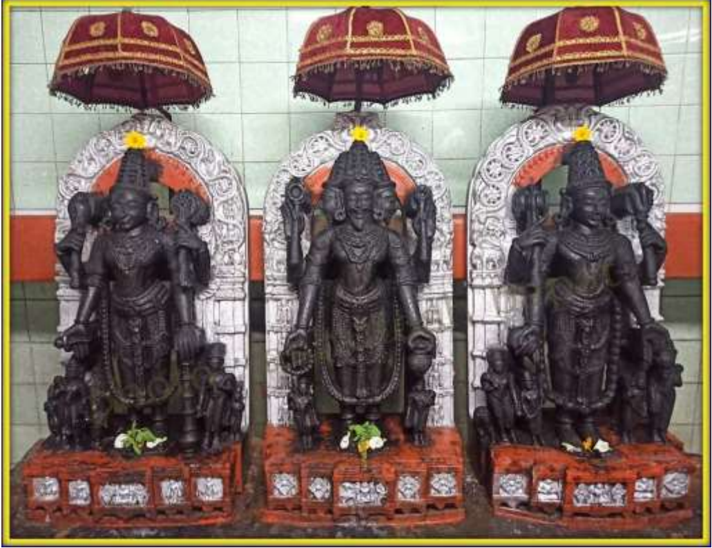
चित्र क्र. ३३ हरीहरपितामह, गोळप, रत्नागिरी

ह्या प्रकारातील मूर्ती म्हणजे ब्रह्मा, विष्णू आणि महेश ह्या तीन देवांचा मिलाप आहे. ह्या मूर्तीमध्ये हे तीनही देव त्यांच्या आयुधांसह, वाहनांसह आणि शक्तींसह दाखविलेले असतात. ह्या सारख्या हरीहरपितामहअर्क अशा देखील मूर्ती आढळून येतात. ह्यात त्रिदेवांबरोबरच सूर्य देखील असतो.