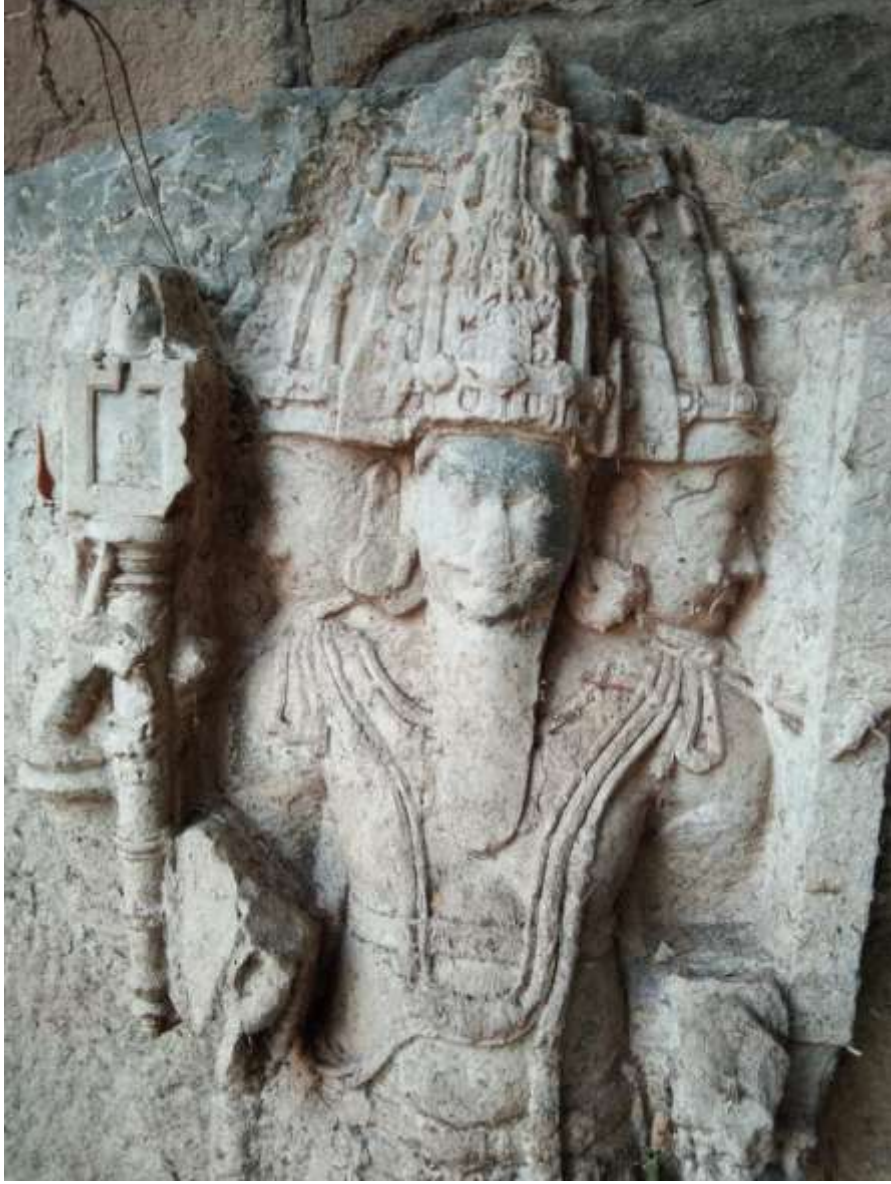
चित्र क्र. १७ ब्रह्मा मूर्ती, मंगळवेढा

मंगळवेढा हे एक तालुक्याचे ठिकाण आहे. सोलापूरपासून ५४ कि.मी. तर पंढरपूरपासून अवघ्या २३ किमी अंतरावर आहे. येथे एक भुईकोट किल्ला असून किल्ल्याच्या मागे असलेले काशीविश्वेश्वराचे मंदिर ही येथील सर्वात पुरातन वास्तु आहे. मूळ मंदिर हे १० व्या अथवा ११व्या शतकातील असावे. त्याचा जीर्णोद्धार १५ व्या शतकात झाला असल्याचा येथील शिलालेख सांगतो. ह्या मंदिराच्या बाजूलाच एक पुरातन विहीर असून तिच्या एका कमानीत ही ब्रह्मदेवाची मूर्ती पूर्वाभिमुख स्थापित केलेली आहे. ही मूर्ती इथे कशी आली ह्या विषयी माहिती उपलब्ध नाही परंतु ह्या मूर्तीच्या बाजूने एक भुयार असून ते मंगळवेढ्याच्या पश्चिमेला एक कृष्ण तलाव