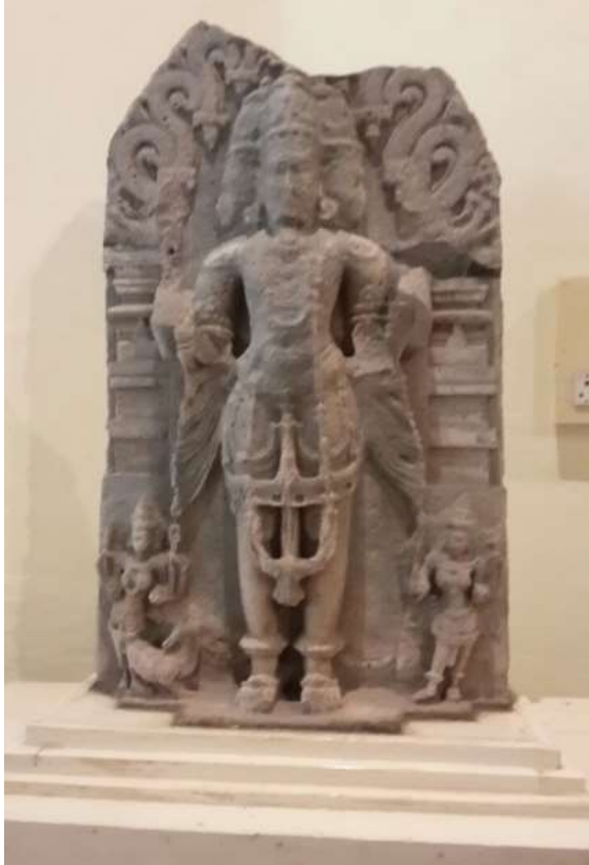
चित्र क्र. २५ ब्रह्मा मूर्ती, थिबा पॅलेस

रत्नागिरी येथील थिबा पॅलेसमध्ये एक संग्रहालय आहे. त्यामध्ये एक ब्रह्मदेवाची मूर्ती आहे. ही मूर्ती ०.९१४ मीटर उंचीची आहे. मूर्ती त्रिमुखी असून चारही हात भग्न आहेत. मूर्तीला प्रभावळ आहे पण ती वरच्या बाजूने भग्न आहे. उजव्या बाजूला सावित्री व डाव्या बाजूला गायत्री आहे. उजव्या बाजूलाच हंस असून मूर्ती सालंकृत आहे.