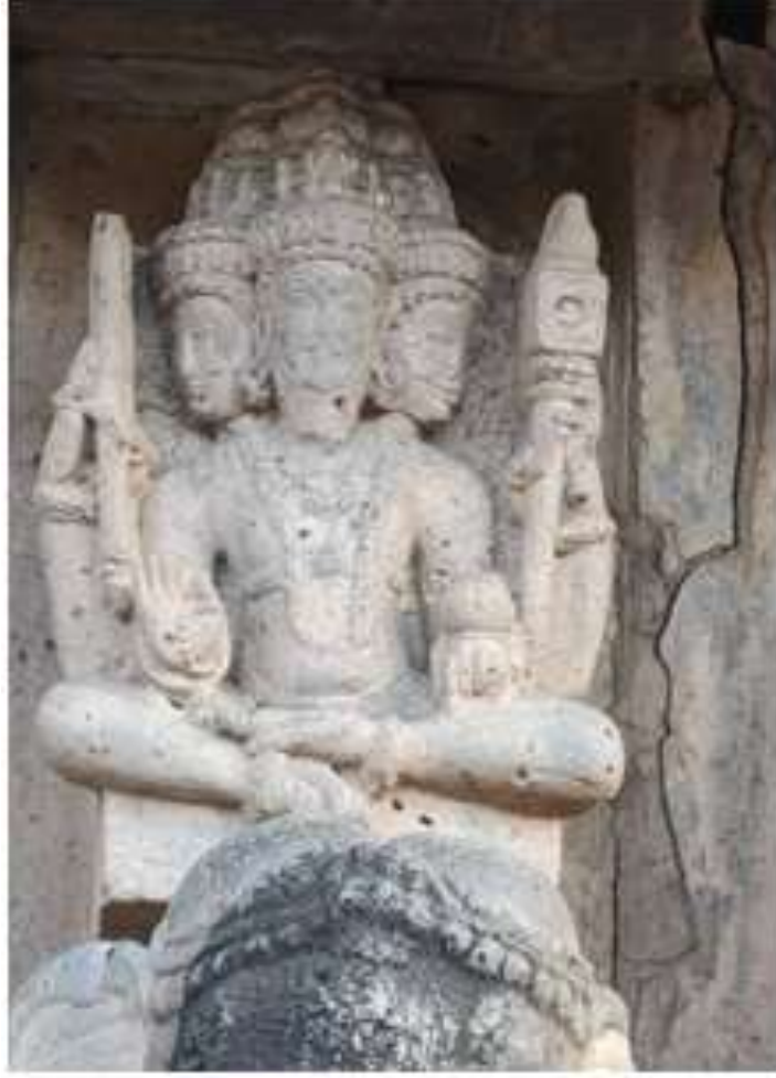
चित्र क्र. २८ गजारूढ ब्रह्मदेव, खिद्रापूर

महाराष्ट्रात सांगलीजवळील खिद्रापूरचे कोपेश्वर महादेव मंदिर उत्कृष्ट शिल्पकलेसाठी प्रसिद्ध असून हे मंदिर सातव्या शतकात बांधायला सुरुवात झाली आणि ११ व्या ते १२ व्या शतकात बांधून पूर्ण झाले असावे. ह्या मंदिराच्या बाह्य भिंतीवर पाच ठिकाणी ब्रह्मदेवाच्या मूर्ती आढळतात. ह्यातील चार मूर्ती आसनस्थ आहेत. एक मूर्ती मंदिराच्या पश्चिमेकडच्या दरवाजावर असून हातात अक्षमाला, दंड, सुक आणि कमंडलू आहे. हंस किंवा शक्ती नाहीत. उरलेल्या तीन मूर्ती थोड्या वेगळ्या आणि विशेष आहेत. हे पूर्ण मंदिर हत्तींनी तोलून धरले आहे अशी कल्पना केलेली आहे. त्यामुळे ह्या तीन मूर्ती तीन दिशांच्या भिंतींवर गजारूढ आहेत. ह्यातील एक मूर्ती