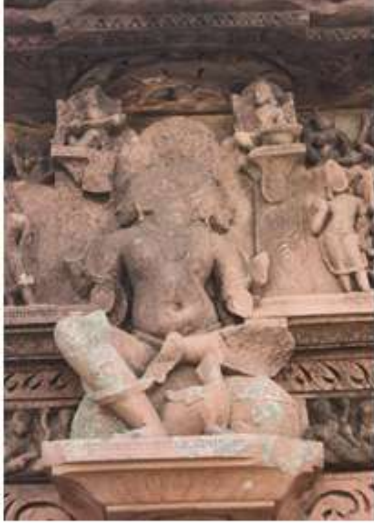
चित्र क्र.३२ ललाटपट्टी वरील ब्रह्मदेव, दुदाही

प्रत्येक गर्भगृहावर वेगवेगळी शिखरे आहेत, मात्र त्यातील ब्रह्मदेवाच्या देवळावरचे शिखर सध्या अस्तित्वात असून बाकीची दोन्ही भंग झालेली आहेत. ह्या ठिकाणी एकूण सहा शिलालेख सापडलेले असून त्यातील पाच लेख कनिंगहॅमने आपल्या रिपोर्टमध्ये प्रसिद्ध केले आहेत.