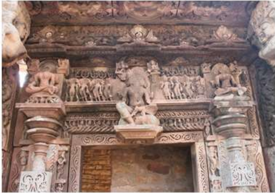
चित्र क्र. ३१ ब्रह्मदेव मंदिराची ललाटपट्टी, दुदाही

उत्तर प्रदेशात ललितपूर जिल्ह्यात दुदाही नावाचे एक छोटे गाव आहे. आत्ता जरी हे छोटे खेडे असले तरी चंदेल राजवटीत हे राजधानीचे ठिकाण होते. या ठिकाणी अनेक मंदिरांचे भग्नावशेष आढळतात. या विषयी अलेक्झांडर कनिंगहॅमने त्याच्या रिपोर्टमध्ये माहिती लिहून ठेवली आहे. येथे जी मंदिरे व अवशेष सापडतात त्यांची तीन भागांत विभागणी केलेली आहे. पहिला भाग बडी सराही व छोटी सराही हा दुसरा भाग आहे, त्या ठिकाणी वराहमूर्तीचा भाग असून तिसरा भाग बनिया की बारात आहे. यातील पहिल्या भागात छोटी सराही येथे एक ब्रह्मदेव मंदिर आहे. हे त्रिकुट मंदिर आहे म्हणजे ब्रह्मा, विष्णू आणि शिव यांची तीन वेगवेगळी गर्भगृहे आहेत पण त्या पुढील मंडप एकच आहे. यातील विष्णू मंदिराचा मंडप पूर्णपणे भग्नावशेष झालेला आहे तर शिव आणि ब्रह्मा मंदिराचा भाग बऱ्यापैकी सुस्थितीत आहे. गर्भगृहाच्या दरवाजाच्या ललाटपट्टीवर नवग्रह, सप्तमातृका यांसारख्या प्रतिमा कोरलेल्या आहेत. शिवाच्या गर्भगृहाच्या ललाटपट्टीवर शिव कोरलेला आहे व आतमध्ये शिवलिंग आहे. तसेच ब्रह्माच्या गर्भगृहाच्या ललाटपट्टीवर ब्रह्मा आणि सावित्री, गायत्री असे कोरलेले आहे; परंतु गर्भगृहात ब्रह्मदेवाची प्रतिमा मात्र नाही. ती भग्नावशेष झाली असावी.