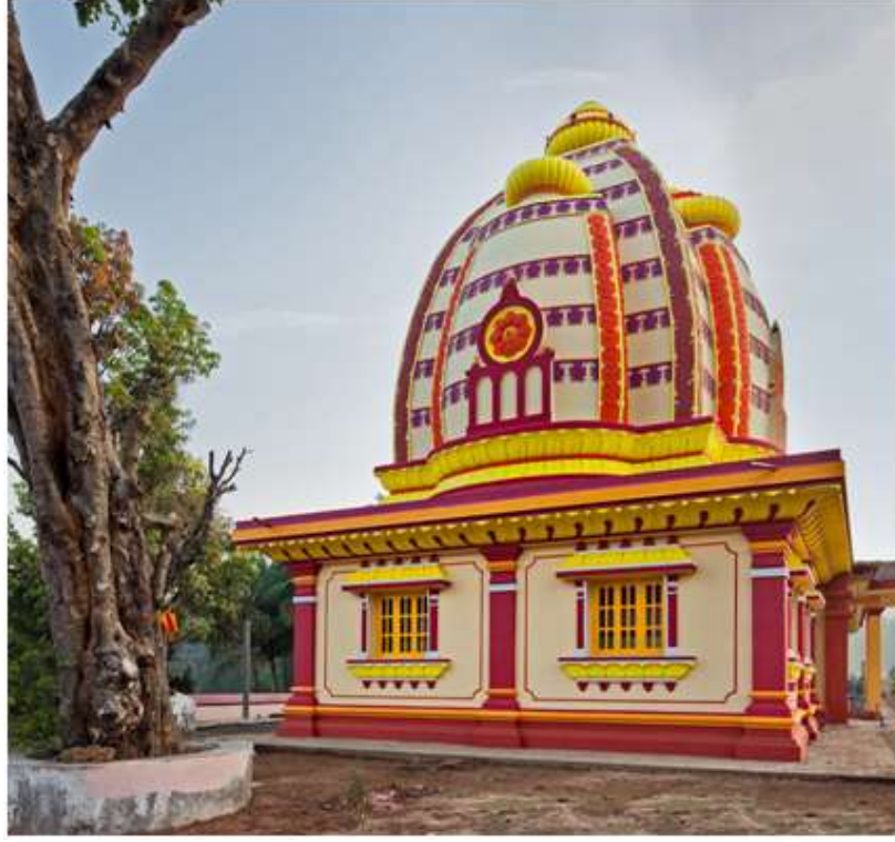
चित्र क्र. ७ ब्रह्मदेव मंदिर, ब्रह्माकरमाळी, गोवा.

गोव्यातील सत्तरी तालुक्यामध्ये ब्रह्माकरमाळी नावाचे एक गाव आहे. जुन्या गोव्यात करमाळी नावाच्या एका गावात एक ब्रह्मदेवाचे मंदिर होते. पोर्तुगीज गोव्यात आले. त्यांनी काही मंदिरांची तोडफोड करायला सुरुवात केली. त्यापासून हे मंदिरही वाचले नाही. परंतु येथील गावकऱ्यांनी ह्या मंदिरातील मूर्ती वेळीच हलवून चांदवडे ह्या गावात आणली. हे गाव जरा लांब आणि दुर्गम भागात असल्याने इथे ती मूर्ती सुरक्षित राहिल असे त्यांना वाटले. हेच चांदवडे गाव करमाळीचा ब्रह्मदेव येथे आल्याने ब्रह्माकरमाळी या नावाने ओळखले जाऊ लागले. सुरुवातीला या ठिकाणी अगदी छोटेसे असेच देऊळ होते. नुकतेच म्हणजे २००८ मध्ये या मंदिराचा जीर्णोद्धार होऊन हे सध्याचे नवे मंदिर बांधण्यात आले. मार्गशीर्ष वद्य तृतीयेला ब्रह्मा या गावात आला म्हणून तोच ब्रह्मोत्सवाचा दिवस असतो. या दिवशी मोठा उत्सव असतो. मंदिरातील गर्भगृहात ब्रह्मदेवाची काळ्या पाषाणातील उभी मूर्ती आहे. चतुर्मुखी ब्रह्मा असून त्याच्या मधल्या मुखालाच दाढी असून बाकीच्यांना दाढी नाही. उजव्या खालील हातात अक्षमाला असून तोच हात वरद मुद्रेत आहे. मागच्या उजव्या हातात सूक्त आहे तर मागील डाव्या हातात पुस्तक आहे व पुढील उजव्या हातात आज्यस्थळी म्हणजेच कमंडलू आहे. जटामुकुट आहे. पायापाशी दोन