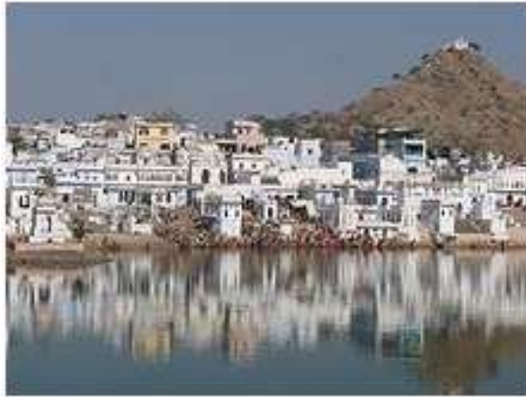
चित्र क्र. ३ पुष्कर तीर्थ, पुष्कर

मंदिर आणि परिसरात स्वच्छता आहे. श्राद्ध व तर्पण विधि करण्याकरिता विशेष गर्दी असते. त्याकरिता मंदिराच्या ट्रस्टचे पुजारी आहेत. इतर क्षेत्रात चालते तशी गिऱ्हाईक