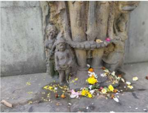
चित्र क्र १४ ब्रह्मा, नालासोपारा

मुखालाच दाढी आहे आणि डाव्या खांद्यावरून हरणाचे कातडे पांघरलेले आहे. मूर्तीच्या उजव्या बाजूला एक शिष्य उभा आहे तर डाव्या व उजव्या बाजूस त्याच्या दोन शक्ती आहेत. देवाच्या उजव्या बाजूला जी शक्ती आहे तिने आज्यस्थळी आणि सुक धारण केले आहे तर डाव्या बाजूच्या शक्तीने पुस्तक धरले आहे.