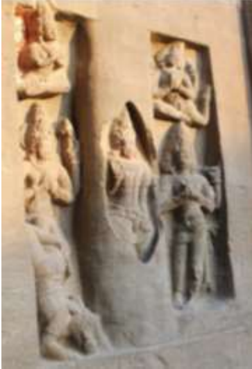
चित्र क्र. २१ लिङ्गोद्भव मूर्ती, वेरूळ गुंफा

औरंगाबाद शहरापासून ३० कि.मी.अंतरावर वेरूळची जगप्रसिद्ध लेणी आहेत. सह्याद्रीच्या सातमाळा डोंगररांगांच्या कड्यात इसवी सनाच्या ५ व्या ते १० व्या शतकात कोरून काढलेली ही लेणी आहेत. ह्यामध्ये गुंफा १६ म्हणजेच कैलास मंदिर आहे. हे द्राविड शैलीचे मंदिर असून शिवाचे आहे. ह्या ठिकाणी बाहेरील भिंतीवर ब्रह्मदेवाच्या प्रतिमा आढळतात. काही स्थानक प्रतिमा आहेत. त्याच बरोबर कल्याणसुंदर मूर्ती देखील आहेत. रमणशिल्पपटाच्या बाजूलाच एक