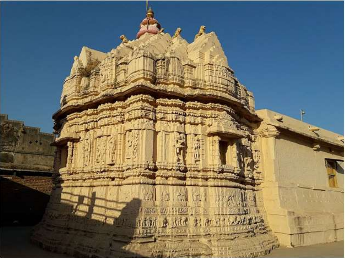
चित्र क्र. ६ ब्रह्मदेव मंदिर, खेडब्रह्म

पाटणच्या चौलुक्य राजवटीची सत्ता होती. मग परिहार राजपूत राजांच्या सत्तेत हा भूभाग आला आणि १३व्या शतकात ईदर ह्या राज्यात हा प्रदेश आला. राणा मेघाजी ह्या राजाने १४७४ मध्ये ह्या ब्रह्मा मंदिराची डागडुजी केली. म्हणजेच १३व्या शतकाच्या आधी ह्या ठिकाणी परमार, चौलुक्य आणि परिहार राजवट होती. सध्याचे हे मंदिर चौलुक्य राजा कर्ण याने ११व्या शतकात बांधलेले आहे. १५' लांब १०' रुंद व ४' उंच अशा विटांचा वापर करून चौथऱ्याचा भाग बांधलेला आहे. गर्भगृहाचा भाग आणि चौथरा मात्र टिकून राहिला आहे आणि त्यावर देवदेवता व अप्सरांच्या मूर्ती कोरलेल्या आहेत. त्यावर मंदिराचा कळस आणि सभामंडपाचा काही भाग नंतर नव्याने बांधलेला आहे. मंदिरातील कोनाड्यात ब्रह्मदेवाच्या मूर्ती देखील आहेत. मंदिराच्या आतील भागात मात्र कोरीव काम नाही. गर्भगृहातील ब्रह्मदेवाची मूर्ती १.६७ मीटर उंचीची आहे. ही मूर्ती मूळची नसावी किंवा जुन्याच भग्न मूर्तीवर व्हाइट सिमेंटचा थर देऊन ती पुन्हा सांधली असावी. (Inamdar, 1936 : 12-14) या ठिकाणी आढळणाऱ्या इतरही शिव, शक्ती आणि सूर्य मंदिरांच्या भग्न अवशेषांवरून ह्या भागाच्या समृद्धतेची साक्ष पटते. दर्शनिकेत दिल्याप्रमाणे ब्रह्मदेवाला स्वतःलाच पवित्र व्हायचे होते. त्यासाठी त्याने विष्णूचा सल्ला घेतला. विष्णूने त्याला