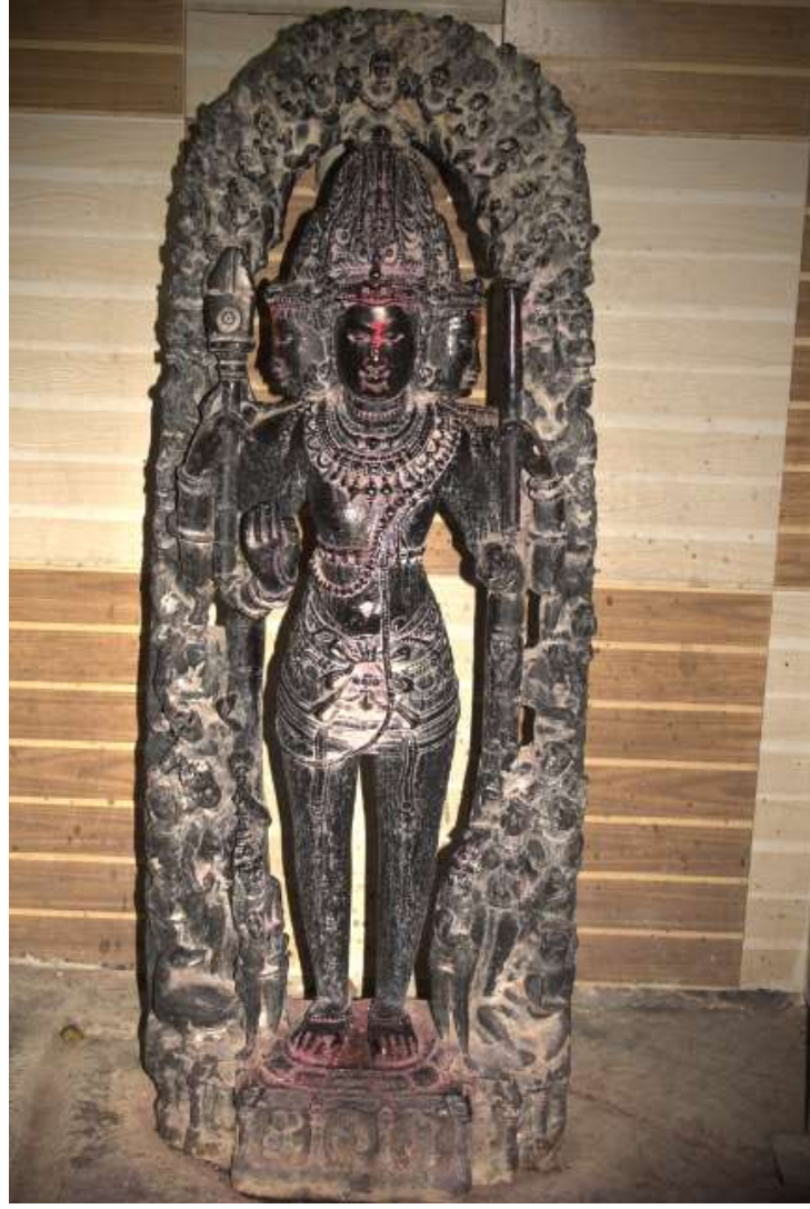
चित्र क्र. ११ ब्रह्मा मूर्ती, शिराढोण

कोरलेला आहे. अष्टदिक्पालांमध्ये इंद्र, यम, अग्नी, निऋती, वरुण, वायु, कुबेर, आणि ईशान आहेत. हे सर्व दिक्पाल पत्नीसह आहेत. ही विशेष अशी गोष्ट आहे कारण विष्णू मूर्तीबरोबर अष्टदिक्पाल दाखविले जातात परंतु ब्रह्मदेवाबरोबर कुठेही आढळत नाहीत. ही मूर्ती राष्ट्रकूट काळातील असून ८व्या किंवा ९व्या शतकातील असावी. परंतु मंदिर मात्र १८व्या किंवा १९व्या शतकातील बांधलेले असावे. (पाठक, २००९ : १३९-१४४)