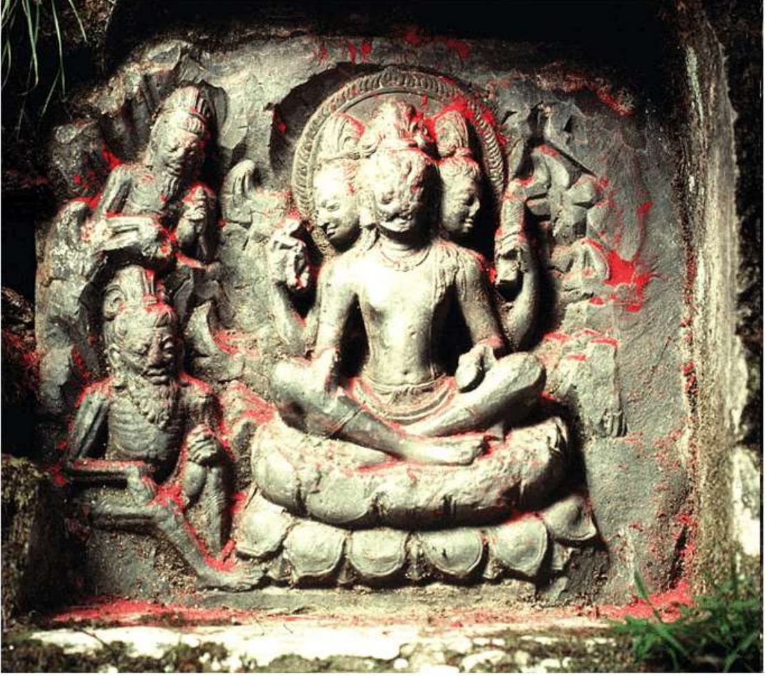
चित्र क्र. ४० मृगस्थळी, नेपाळ

इंडोनेशियाप्रमाणेच नेपाळमध्येही ब्रह्मदेवाच्या मूर्ती आढळतात. नेपाळ येथील प्रसिद्ध पशुपतिनाथ मंदिराच्या आवारात बऱ्याच देवदेवतांच्या मूर्ती आढळतात त्यात ब्रह्मदेवाच्याही मूर्ती आहेत परंतु त्या भग्नावस्थेत आहेत. देवपाटण, चपागाव येथेही ब्रह्मदेवाच्या मूर्ती आहेत परंतु मृगस्थळी नावाच्या गावातील मूर्ती छान सुबक आहे. ही मूर्ती चतुर्भुज, चतुर्मुखी आहे. खालचा डावा हात भग्न झालेला आहे वरील डाव्या हातात अक्षमाला, वरील उजव्या हातात वेद तर खालील दोन हात भग्न आहेत. ब्रह्मा कमलारूढ असून बाजूला दोन ऋषी देखील आहेत; ब्रह्माची शक्ती आणि हंस मात्र नाही. देवपाटण येथील मूर्ती द्विभुज असून चारही बाजूंनी मुख आहे आणि कमलारूढ आहे. इथेही हंस, शक्ती नाही.