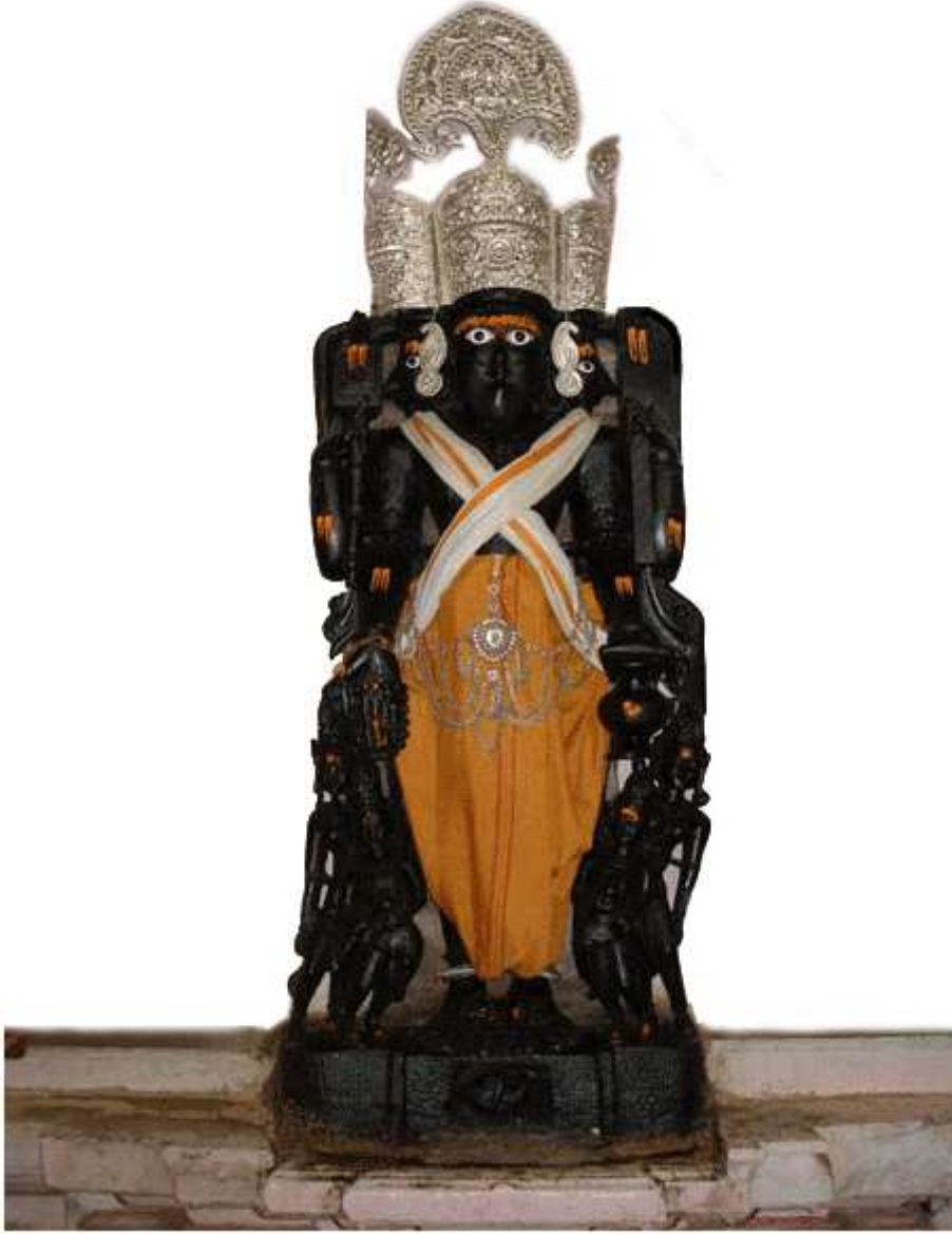
चित्र क्र. ४ ब्रह्मदेव मूर्ती, छिंच