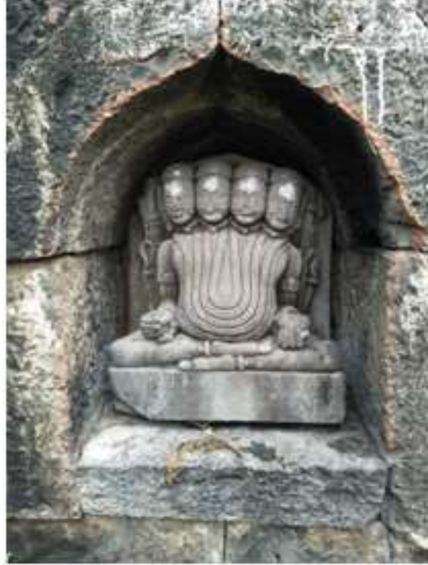
चित्र क्र. २६ ब्रह्मदेव, संगम माहुली, सातारा

सातारा येथील रामेश्वर मंदिरातील ब्रह्मा मूर्ती : संगम माहुली ह्या तीर्थक्षेत्री रामेश्वराचे मंदिर आहे. ह्या मंदिराच्या कोनाड्यात एक ब्रह्मदेवाची मूर्ती आहे. ह्या मूर्तीजवळ ब्रह्मदेवाच्या शक्ती नाहीत, हंसही नाही. खालच्या उजव्या हाती अक्षमाला तर डाव्या हातात कमंडलू आहे. मागील डाव्या हातात स्रुक सदृश काही तरी आहे तर मागच्या उजव्या हातात दंड आहे. ब्रह्मदेवाच्या मूर्तीची चारही मुखे एका शेजारी एक अशी दाखविली असून मुखांना दाढी नाही पण मिशा आहेत. रामेश्वर मंदिराच्या बाह्य भिंतीवरील एका कोनाड्यात ही मूर्ती आहे. स्थानिक लोक ह्या देवाला बर्म्या म्हणतात; जो बरमदेव म्हणजेच ब्रह्मदेव ह्या शब्दाचा अपभ्रंश असू शकतो. ही माहिती तिथे उपस्थित असलेल्या एका स्थानिकानेच संशोधकाला दिली.