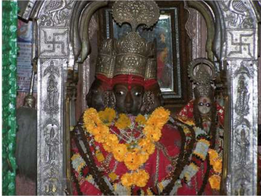
चित्र क्र. २ ब्रह्मदेव मूर्ती, पुष्कर

ब्रह्मदेवाच्या मंदिराचे नाव जगदपिता ब्रह्मा मंदिर असे आहे. हे मंदिर एका उंच चौथऱ्यावर बांधलेले असून ह्याचे बांधकाम आठव्या शतकातील आहे आणि आदि शंकराचार्यांनी सर्वप्रथम इ.स. ७१८ मध्ये याचा जीर्णोद्धार केला असे इथे सांगितले जाते. विश्वामित्र ऋषींनी हे मंदिर बांधले अशीही आख्यायिका ह्या भागात प्रचलित आहे. मुघल आक्रमणात ह्या मंदिराची बरीच पडझड झाली होती. सध्याचे जे मंदिर आहे त्याचा जीर्णोद्धार इ.स.१४०१ मध्ये रतलामचे महाराजा जवंतराज यांनी केला आहे. (Rajputana Gazetteer Vol.1A, 1904 : 18-20)