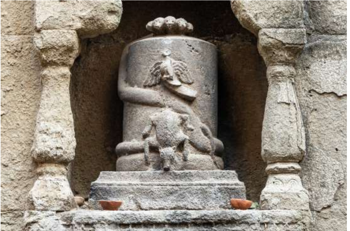
चित्र क्र. ३० शोधकर्ता ब्रह्मा, त्रिशुंड गणपती, पुणे

ह्या प्रकारातील मूर्ती मंदिरांच्या बाहेरच्या भागातील भिंतींवर आढळतात. ह्यात लिङ्गोद्भवाची कथा दर्शवलेली असते. ज्योतिर्लिंग स्वरूपात शिव असतो. त्याच्या आदिचा शोध घेणारा ब्रह्मदेव वरच्या भागात दर्शविलेला असतो तर अंताचा शोध घेणारा विष्णू खालील भागात दाखविलेला असतो. काही ठिकाणी ज्योतिर्लिंग स्वरूपातील शिवासमोर हात जोडून असलेले ब्रह्मा व विष्णू