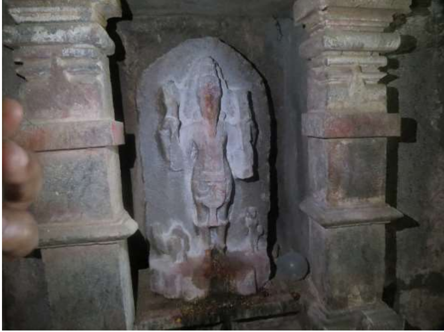
चित्र क्र. ३५ ब्रह्मदेव, तारापूर

पंढरपूर तालुक्यात एक तारापूर गाव आहे. ह्या गावात एक त्रिकुट मंदिर आहे. मंदिरात गर्भगृहात एक ब्रह्मदेवाची उभी मूर्ती आहे. तसेच एक मूर्ती कोनाड्यात सुद्धा आहे. गर्भगृहातील मूर्ती प्रभावळीसकट असून तिचा खालचा डावा हात भग्न आहे, मागील डाव्या हातात सुक असून मागील उजव्या हातात पुस्तक आहे. खालील डाव्या हातात कमंडलू दिसत आहे. मूर्तीच्या पायाशी उजव्या बाजूला एक हंस आहे तर डाव्या बाजूला सेविका असून तिच्या हातात चवरी आहे. ही मूर्ती शिलाहार कालीन म्हणजे अंदाजे आठव्या ते दहाव्या शतकातील असावी.