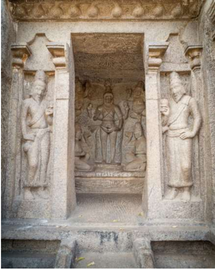
चित्र क्र. ३६ ब्रह्मा मूर्ती, महाबलीपुरम

विष्णू व शिव यांच्यासाठी आहे. या तिन्हीच्या स्वतंत्र मूर्ती प्रत्येक कक्षात असून त्यांच्या पायाशी भक्तगण तसेच वरच्या बाजूला उडते गण दर्शविलेले आहेत. येथील ब्रह्मदेवाची मूर्ती मात्र