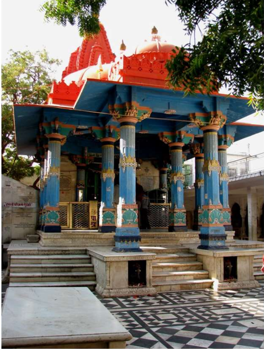
चित्र क्र. १ जगदपिता ब्रह्मा मंदिर, पुष्कर

हे माहीत असूनही तू तो घडू दिलास म्हणून कलियुगात तुझा सतत अपमान होईल. त्याप्रमाणे धूम्रपान इत्यादीसाठी वापरला जातो व बरेचदा अग्नी पायाखाली विझवला जातो म्हणजे एक प्रकारे त्याचा अपमानच होतो. मग तिने ब्रह्मदेवाला शाप दिलो की पुष्कर सोडल्यास कुठेही तुझे पूजन होणार नाही, तू अपूज्य होशील, तुझे कुठेही मंदिर होणार नाही आणि झाले तर मी ते उद्ध्वस्त करीन. एवढे बोलून सावित्री रागावून तिथून निघून गेली आणि पुष्करच्या बाजूच्याच एका टेकडीवर जाऊन बसली. म्हणून मग तेव्हापासून ब्रह्मा अपूज्य झाला आणि त्याचे कुठेही दुसरीकडे मंदिर नाही. (मंदिराचे महंत यांनी स्वतः ही कथा सांगितली. जानेवारी २०१५) त्या टेकडीवर सध्या सावित्रीचे मंदिर आहे. त्याच डोंगराच्या समोर अजून एक डोंगर आहे त्यावर