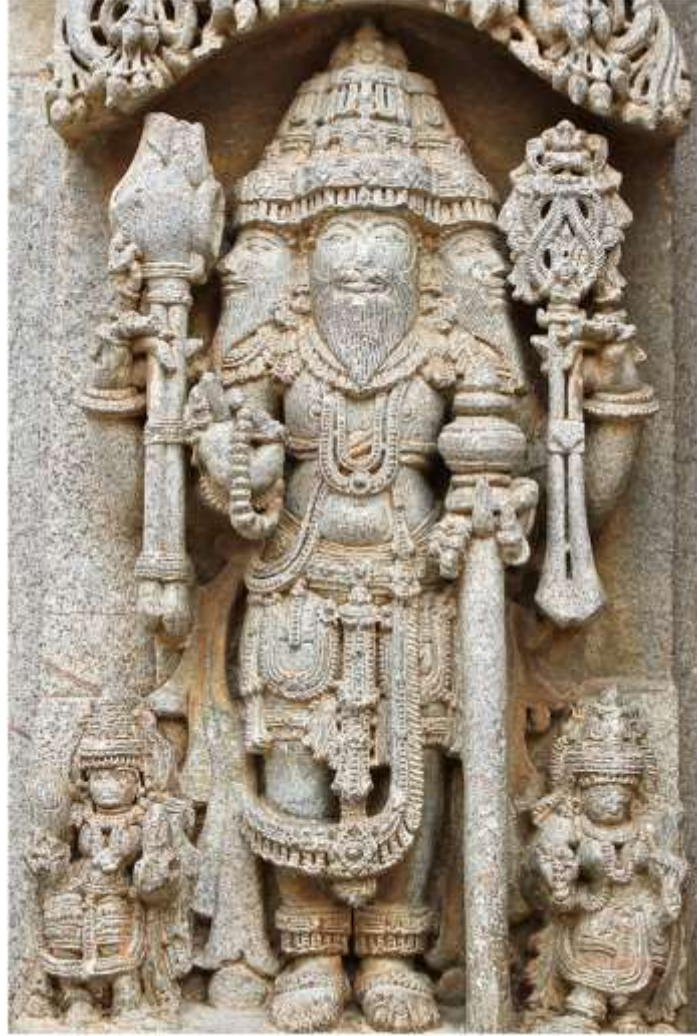
चित्र क्र. १९ ब्रह्मा मूर्ती, सोमनाथपुरा

हे मंदिर सोमनाथपुरा, कर्नाटक येथे आहे. १३व्या शतकातील हे मंदिर होयसाळ राजा नरसिंह ३ याचा मंत्री सोमनाथ दंडनायक याने बांधले. ह्या मंदिराच्या बाहेरील भिंतीवर ब्रह्मदेवाच्या दोन मूर्ती आहेत. सर्व मूर्ती साधारणपणे ०.६० मीटर असून पाया ते तोरण अशी उंची अंदाजे ०.९१४ मीटर आसपास आहे. सर्व देवदेवतांच्या मिळून एकूण १९४ मूर्ती असून त्यांपैकी फक्त दोन मूर्ती ब्रह्मदेवाच्या आहेत. एका मूर्तीला दाढी आहे तर दुसरी मूर्ती दाढी नसलेली आहे. दोन्ही मूर्तीपैकी एका मूर्तीच्या हातात प्रदक्षिणामार्गाने अक्षमाला, सुक, सुवा तर खालचा डावा हात भग्न आहे. तर दुसऱ्या मूर्तीच्या हातात प्रदक्षिणाक्रमाने अक्षमाला, सुक, पाश, कमंडलू दिसतात. एक हात अभयमुद्रेत आहे. परंतु लक्षात घेण्यासारखी गोष्ट म्हणजे ह्या १९४ मूर्तींमध्ये रामायण, महाभारत, दशावतार, इंद्र इत्यादी देवांच्या मूर्ती आहेत.