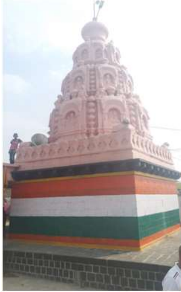
चित्र क्र. १० परमेश्वर मंदिर, शिराढोण, नांदेड.

शिराढोण हे गाव कंधार तालुक्यात नांदेड पासून ३० कि.मी. वर आहे. तेथे एका गढीजवळ हे ब्रह्मदेवाचे मंदिर आहे. हे मंदिर परमेश्वर मंदिर म्हणून प्रसिद्ध आहे. एक छोटा सभामंडप आणि एक गर्भगृह असे छोटेसेच हे मंदिर आहे. गर्भगृहात एका उंच पिठावर ही ब्रह्मदेवाची मूर्ती आहे. ही मूर्ती उभी असून १.०५ मीटर उंच आहे. प्रदक्षिणाक्रमाने मूर्तीचा उजवा हात अभयमुद्रेत व त्याच हातात अक्षमाला आहे. उजव्या वरच्या हातात सुक तर मागील डाव्या हातात दंड धरलेला आहे. मूर्तीचा डावा खालील हात मनगटापासून तुटलेला असून त्या हातात कमंडलू असावा. चतुर्मुखी मूर्ती असून एकाही मुखाला दाढी मिशा नाहीत. मूर्तीच्या मागील बाजूस सुद्धा चौथे मुख व शरीराचा मागील भाग दाखवलेला आहे. जटामुकुट, कुंडले आणि अनेक दागिन्यांनी मूर्ती नटवलेली आहे. उजव्या बाजूला खाली हंस आहे. खाली पादपीठावर यक्ष व भारवाहकांच्या प्रतिमा आहेत. मूर्तीला अतिशय सुंदर प्रभावळ असून त्यात अष्टदिक्पाल व विद्याधरांचा पट