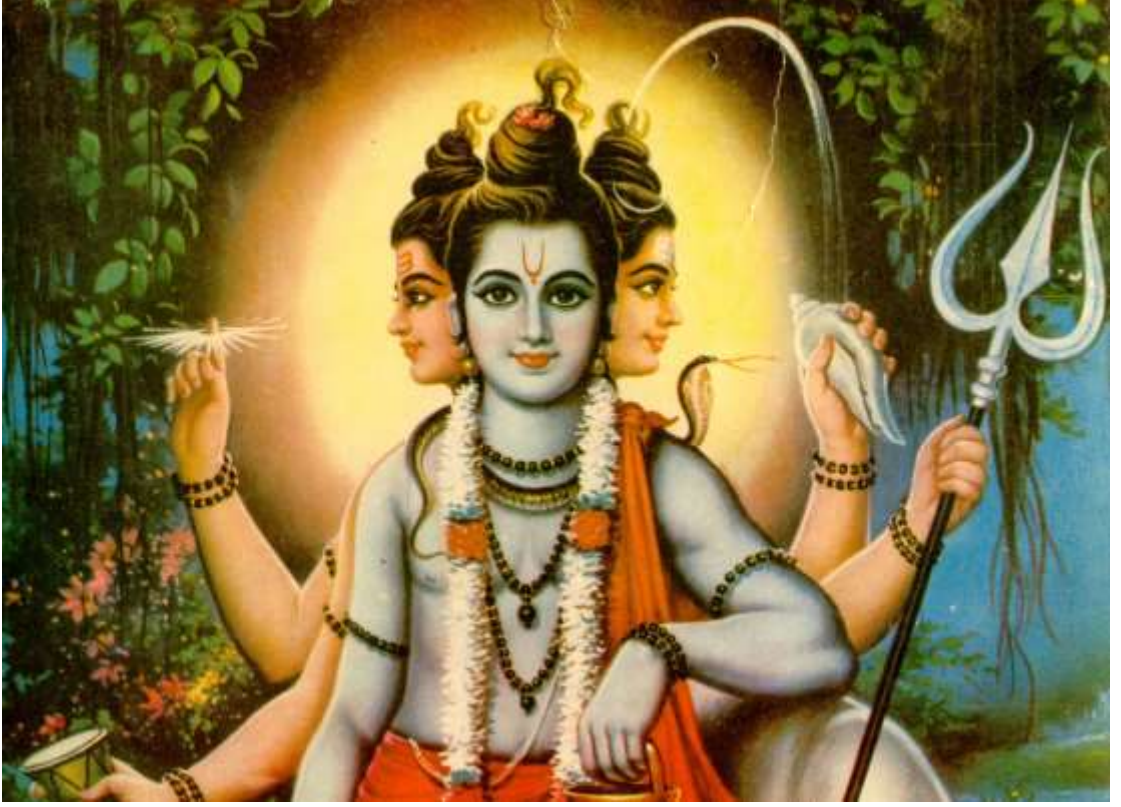
चित्र क्र. ३७ दत्तमूर्ती

एकट्या ब्रह्मदेवाची पूजा आता होत नसली तरीही त्रिमूर्ती किंवा दत्तरूपात तो आजही पूजला जात आहे. भारतभर जरी दत्त संप्रदायाचा प्रसार झाला नसला तरी महाराष्ट्र, गोवा, कर्नाटक, तेलंगणा, आंध्र प्रदेश आणि गुजरात ह्या राज्यांमध्ये दत्ताची मोठ्या प्रमाणावर उपासना केली जाते. दत्तजन्माची ही कथा पाहू.