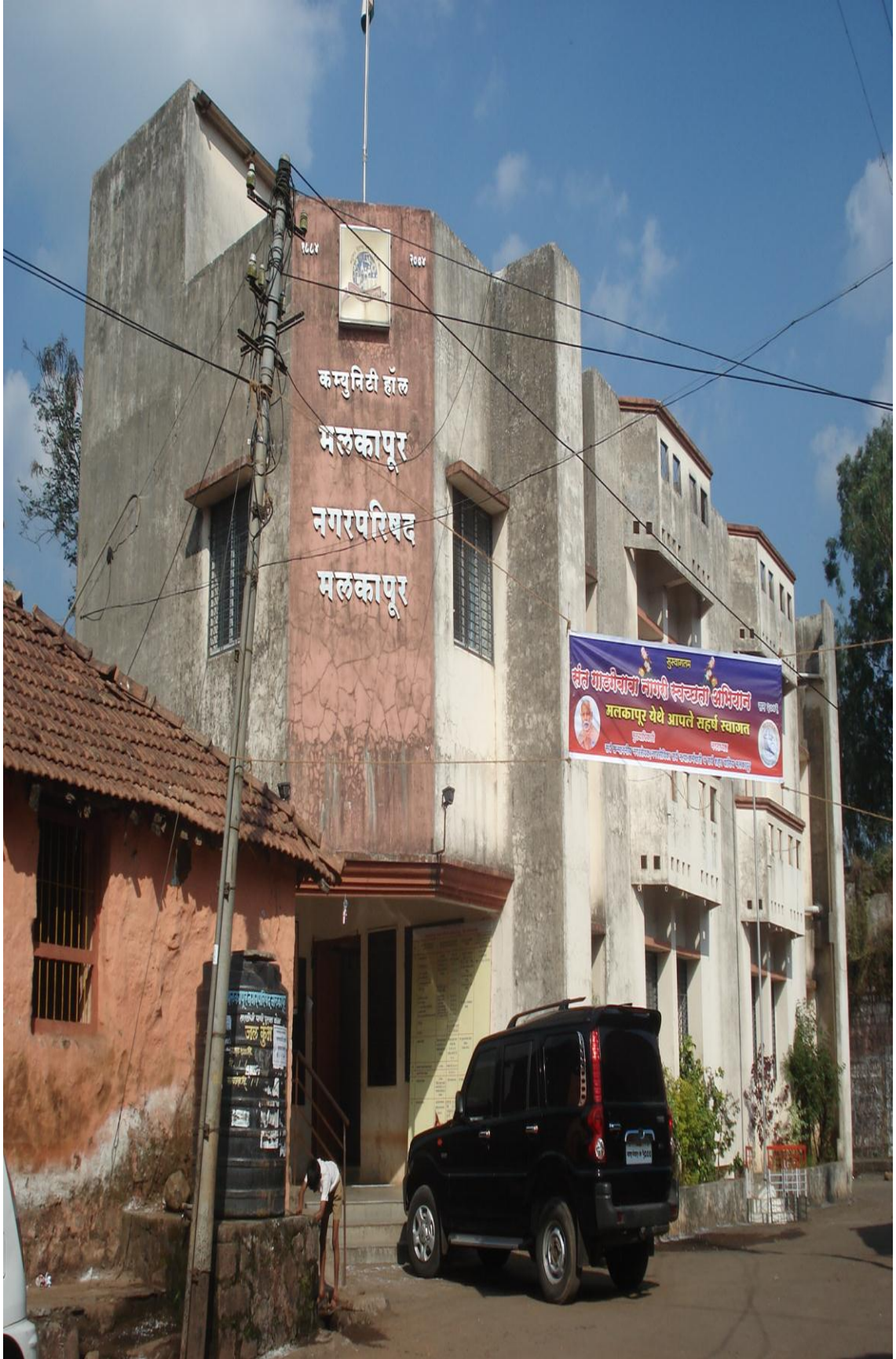
मलकापूर नगरपरिषद कार्यालय [निवीन इमारत]