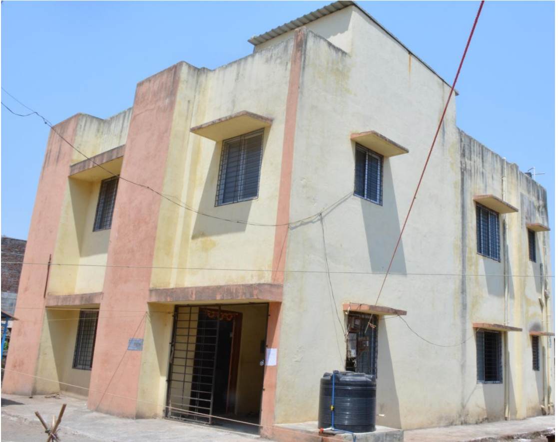
सार्वजनिक वाचनालय अलकापूर नवीन इमारत