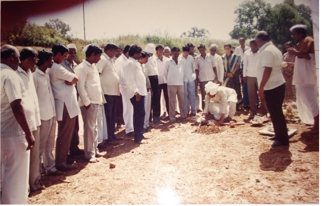
जॅकवेल ष्रौणी भूमीपूजन प्रसंग