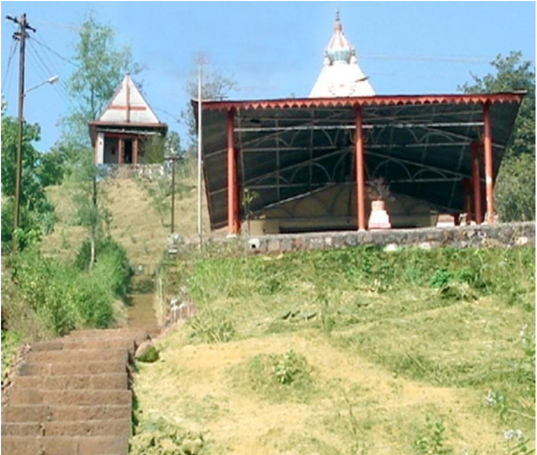
श्री .महादेव मंदिर मलकापूर