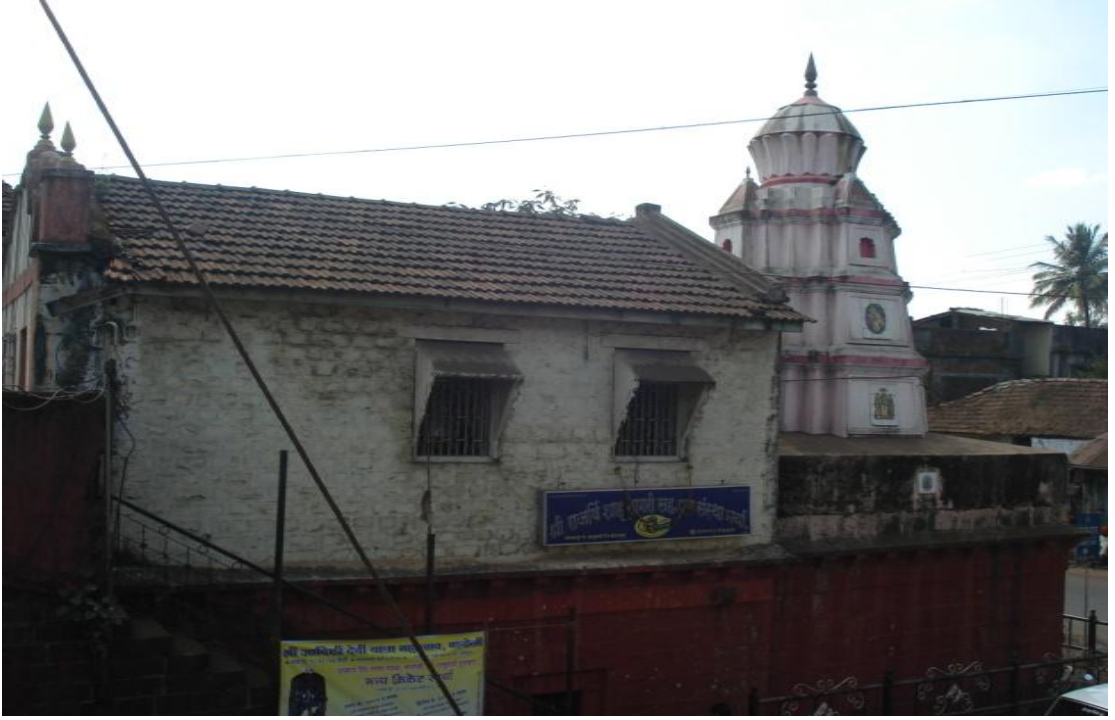
श्री .विडुल मंदिर मलकापूर