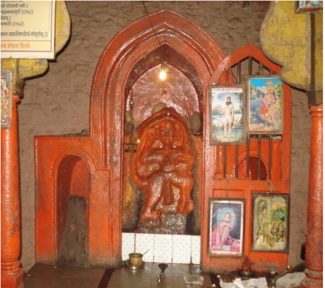
श्री .हनुमान मंदिर मलकापूर