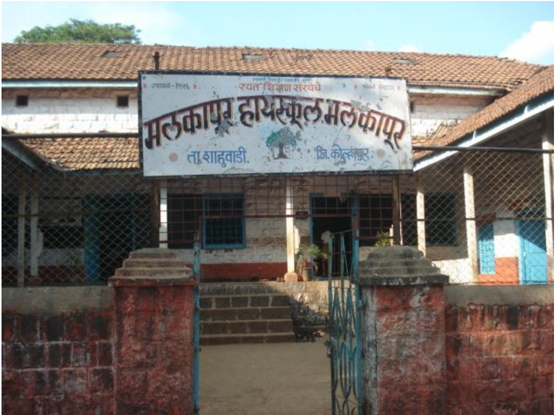
मलकापूर हायस्कूल मलकापूर