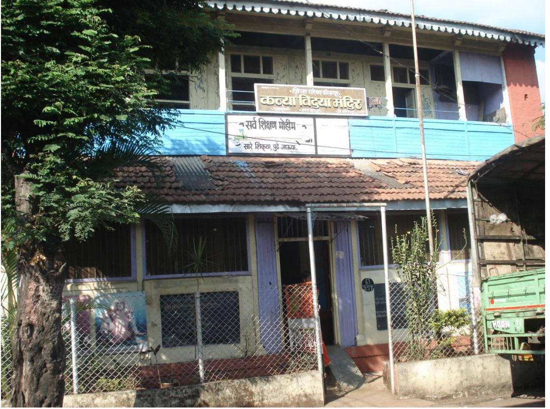
कन्या विद्यामंदिर मलकापूर