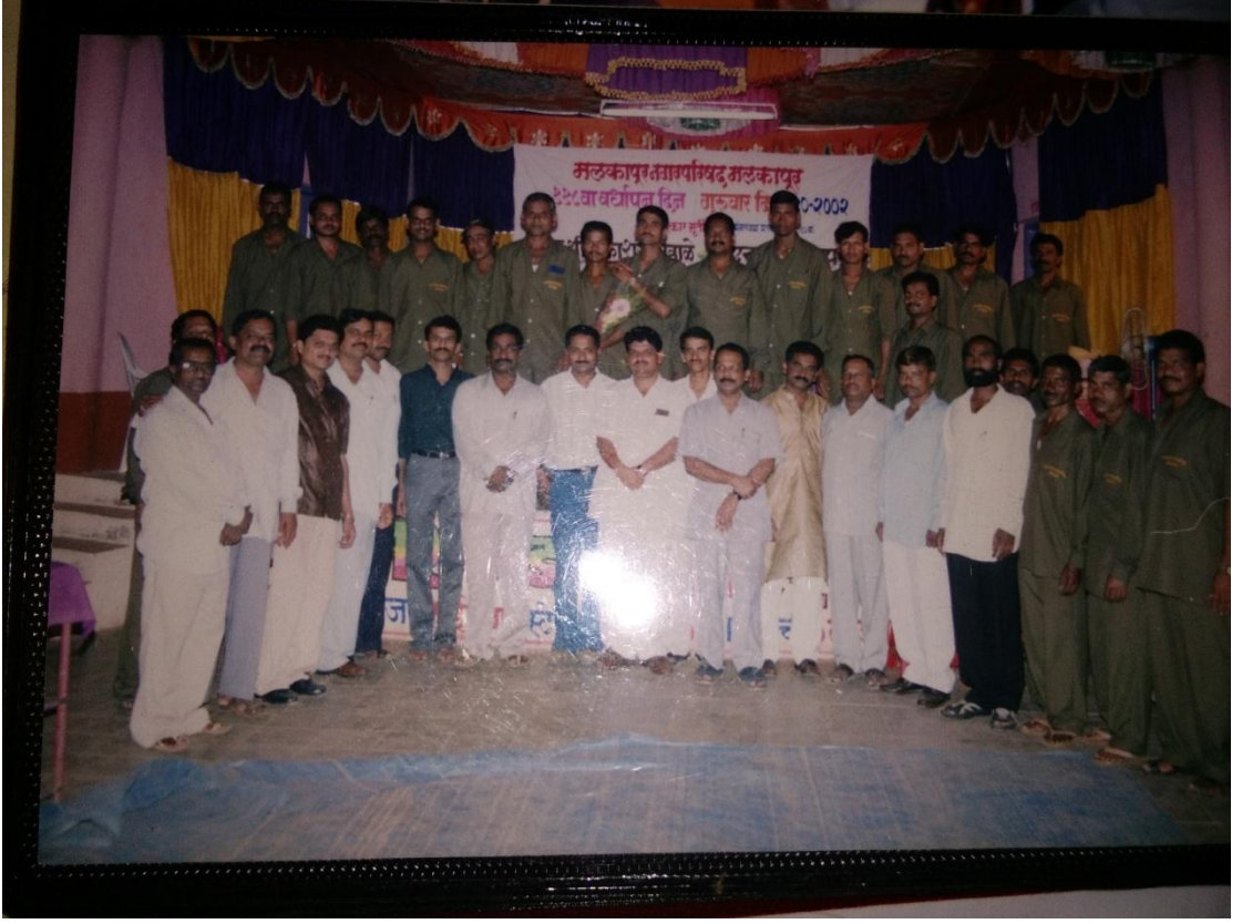
नगरपरिषदेचे कर्मचारी सन २००२-२००३