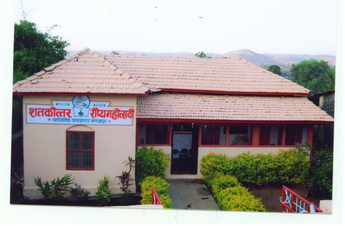
सार्वजनिक वाचनालय अलकापूर जुनी इमारत