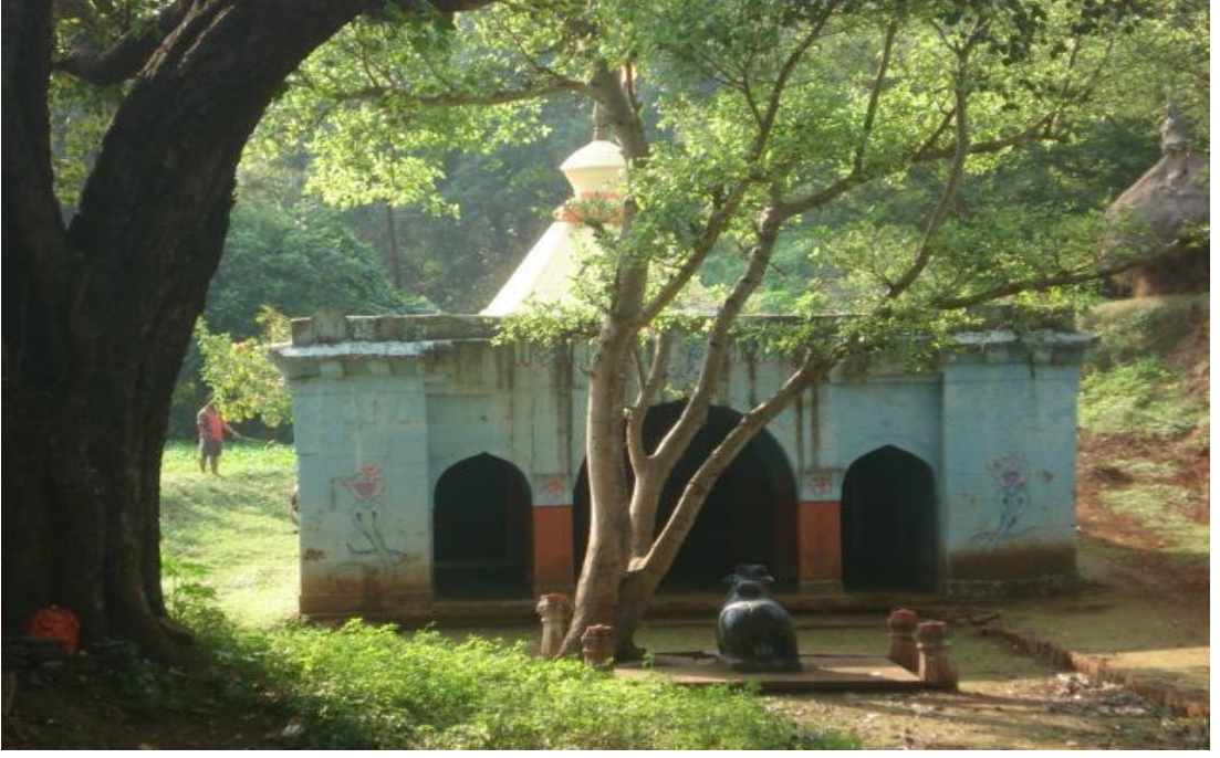
श्री .महादेव मंदिर मलकापूर