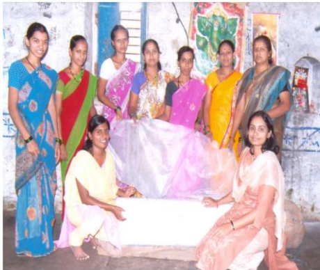
सखी महिला बचत गटाचा सॅनेटरी नॅपकीन प्रकल्प (रेंदाळ, ता. हातकणंगले)