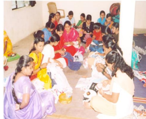
विणकाम प्रशिक्षण घेत असताना महिला (सरुड, ता. शाहुवाडी)