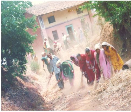
ग्रामस्वच्छतेत महिलांच्या बरोबरीने पुरुषांचा सहभाग (चव्हाणवाडी, ता. पन्हाळा)