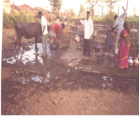
जलस्वराज्य प्रकल्पापूर्वीची भिण्याचे पाणी खोताभोवतालची अवस्था (सातार, ता. पन्हाळा)