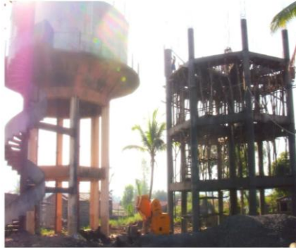
नवीन साठवण टाकीचे बांधकाम सुरु असताना (कुंभोज, ता. हातकणंगले)