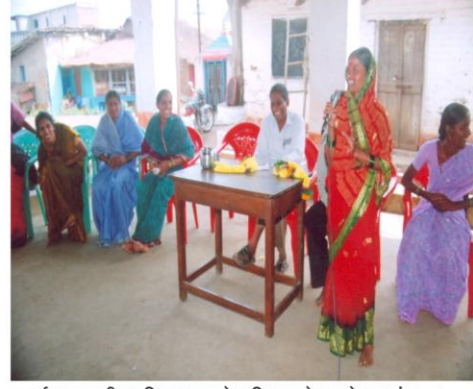
दुर्बल घटकातील महिला धाडसाने व विश्वासाने आपले मत मांडताना (कोवाड, ता. चंद्रगड)