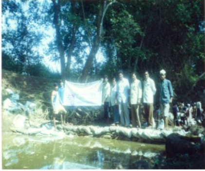
पाणी टंचाईवर मात करण्यासाठी ग्रामस्थांनी बांधला वनराई बंधारा (करंबळी, ता. गडहिल्लज)