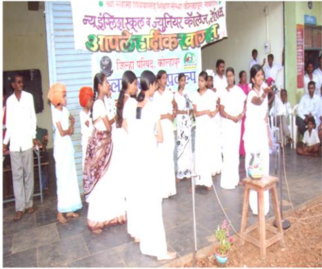
'स्वच्छतेतून समृद्धीकडे' पथनाट्याद्वारे प्रबोधन (रेंदाळ, ता. हातकणंगले)