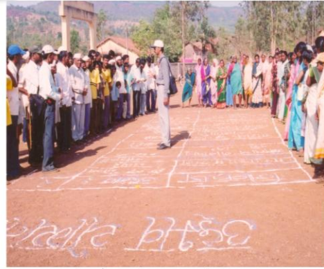
ग्रामस्थांच्याबरोबर चर्चा करून उद्भव निश्चित करताना (कडगाव, ता. भुदरगड)