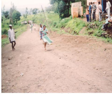
धावण्याच्या स्पर्धेतील सहभागी महिला (पिंपळवाडी, ता. राधानगरी)