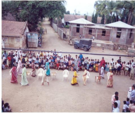
संगीत खुर्ची स्पर्धेचा मुक्त आनंद लुटणाऱ्या महिला (करंबळी, ता. गडहिंग्लज)