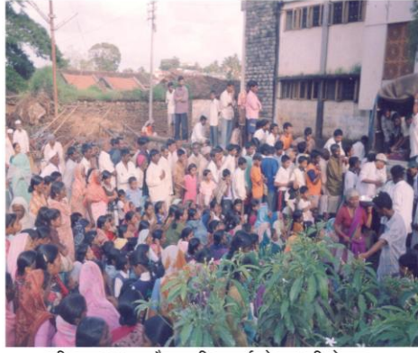
स्त्री-पुरुष अभ्यासदौऱ्यासाठी उत्स्फूर्तपणे सहभागी होताना (करंबळी, ता. गडहिंग्लज)