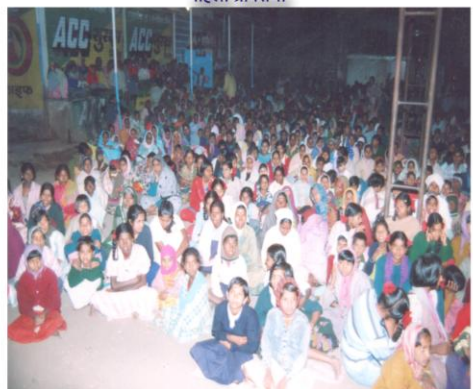
रात्रीच्या महिला ग्रामसभेसाठी उपस्थित महिला वर्ग (माले, ता. पन्हाळा)