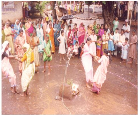
भर पावसात रंगलेली झिम्मा फुगडी स्पर्धा (मिणचे खुर्द, ता. भुदरगड) महिला ग्रामसभा