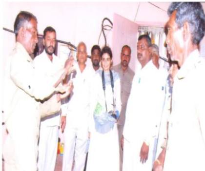
जागतिक बँकेच्या अधिकाऱ्यांना ओ.टी.टॅस्ट करून दाखविताना पाणीपुरवठा कर्मचारी (रेंदाळ, ता. हातकणंगले)