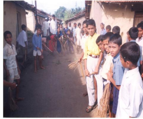
ग्रामस्वच्छतेत शालेय विद्यार्थ्यांचा सक्रिय सहभाग (करंबळी, ता. गडहिंग्लज)