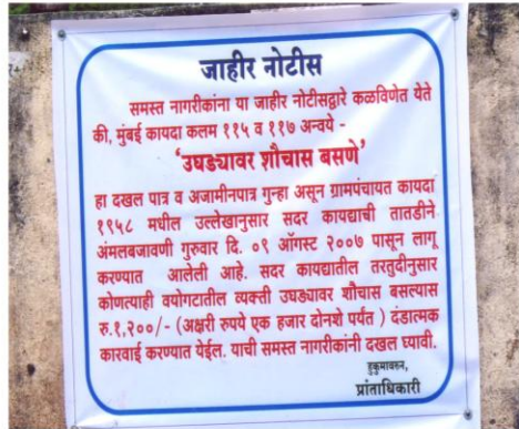
प्रबोधनासोबत कायद्याचाही आधार (भादवन, ता. आजरा)