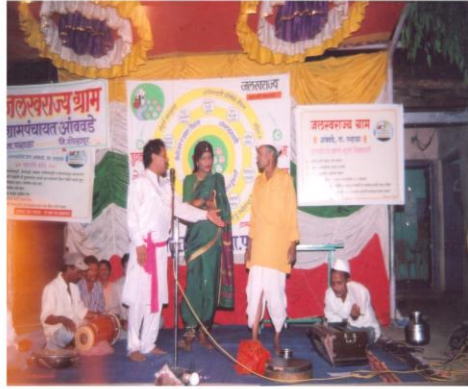
'लेक वाचवा' प्रबोधनात्मक नाट्य सादर करताना ग्रामस्थ (आंबवडे, ता. पन्हाळा)