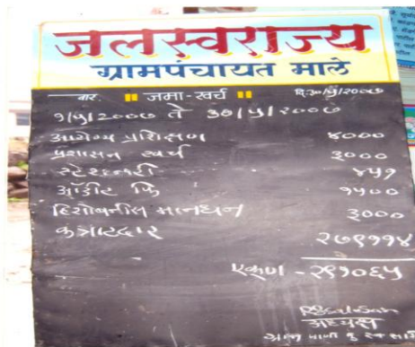
जलस्वराज्य प्रकल्पावरील जमाखर्चाचा पारदर्शी कारभार (माले, ता. पन्हाळा)