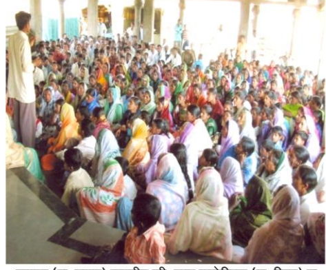
सुळकूड (ता. कागल) गावातील स्त्री-पुरुष कवठेपिराण (ता. मिरज) या या आदर्श गावाला भेट देऊन उपक्रम समजावून घेताना