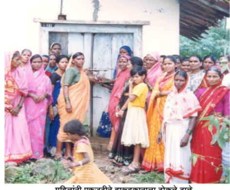
महिलांनी एकजूटीने दारुदुकानाला टोकले टाळे (करंबळी, ता. गडहिंग्लज)