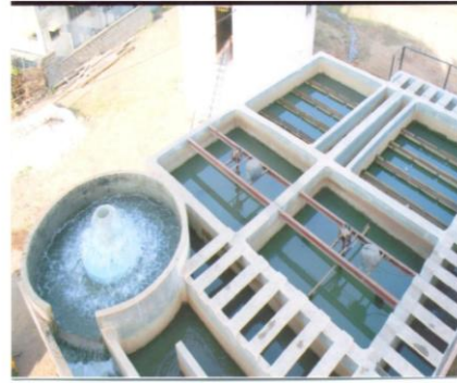
शुद्ध पाणी, उत्तम आरोग्य ! जलशुद्धीकरण केंद्र (रेंदाळ, ता. हातकणंगले)