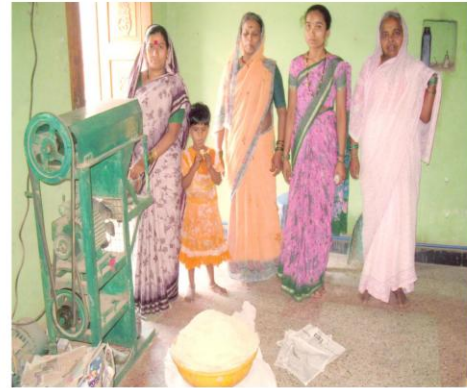
ओम गुरुदेव महिला बचत गटाचा शेवया उद्योग (सुळकूड, ता. कागल)