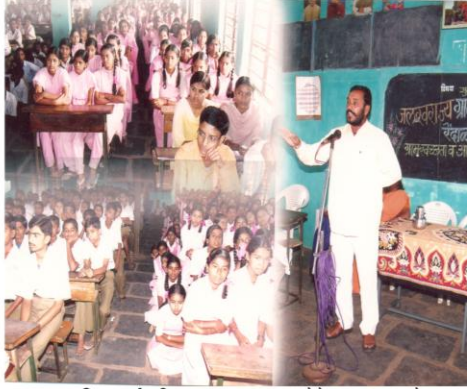
विद्यार्थ्यांनाही जलसाक्षरता व स्वच्छतेचे महत्त्व पटवून देताना (रेंदाळ, ता. हातकणंगले)