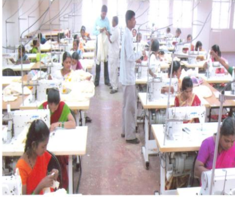
गारमेंट प्रशिक्षण घेत असताना महिला (रेंदाळ, ता. हातकणंगले)