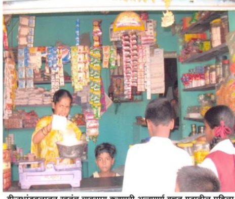
बीजभांडवलातून स्वतंत्र व्यवसाय करणारी अन्नपूर्णा बचत गटातील महिला (सुळकूड, ता. कागल)