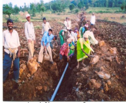
पुरुषांच्या बरोबरीने श्रमदान करताना महिला (पिंपळवाडी, ता. राधानगरी)