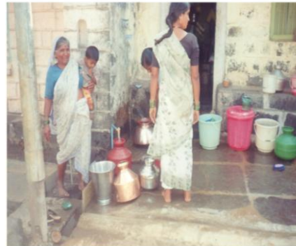
जलस्वराज्य प्रकल्पाच्या माध्यमातून दारात आलेल्या पाण्यामुळे आनंदी दिसणारी महिला