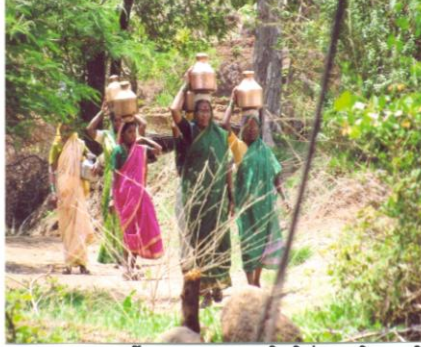
जलस्वराज्य प्रकल्पापूर्वी जन्हातान्हात पाण्यासाठी स्त्रीयांना करावी लागणारी वणवण (मिणचे खूर्द, ता. भुदरगड)