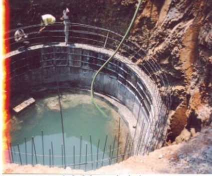
जलस्वराज्य प्रकल्पांतर्गत विहीर जलस्त्रोताचे बांधकाम सुरु असताना (देसाईवाडी, ता. पन्हाळा)