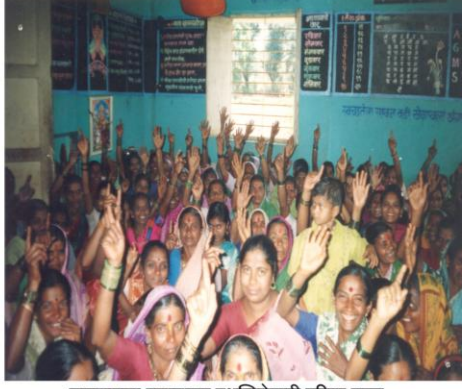
जलस्वराज्य प्रकल्पाच्या यशस्वितेसाठी महिला सज्ज (करडवाडी, ता. भुदरगड)