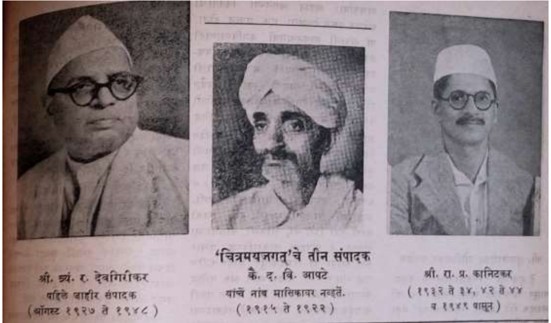
चित्रमय जगतचे संपादक